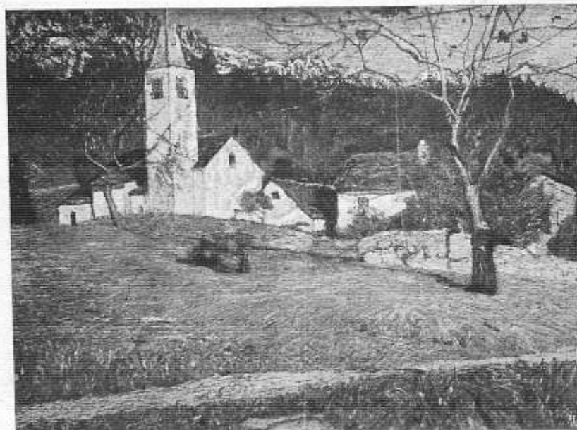
Quadro di Carlo Fornara

C'era una volta sulla vetta del Monte Picus un maestoso turrato castello, al quale convenivano