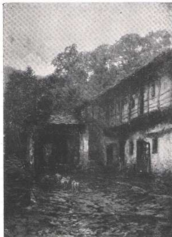
Interno a Gignese