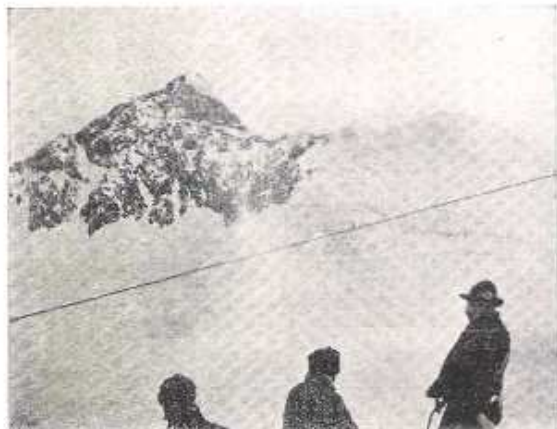
Il Naso e il Lyskamm salendo alla Margherita