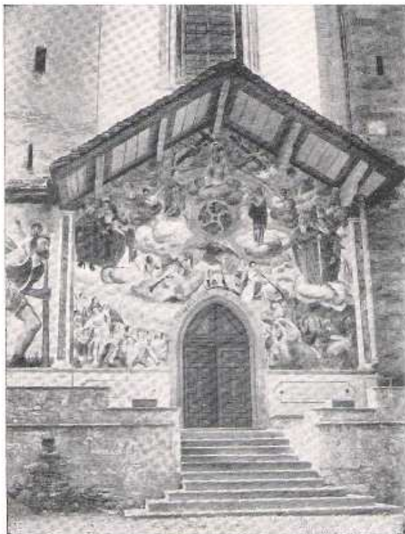
Il gran fresco di Riva Valdobbia

A Varallo, non per noi ma pel ferragosto che suscita grande fervore di mercato, troviamo un vivace fluttuare di costumi valesiani che ci compensa della mancanza di tempo per visitar la città, e che si ripete a traverso tutta la Valsesia, fino ad Alagna.