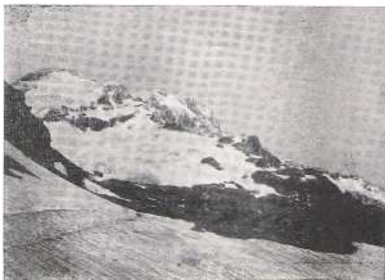
Il Rosa dal ghiacciaio del Lys