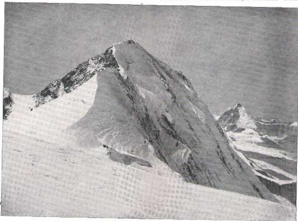
Il Lyskamm e il Cervino veduti dall'Osservatorio «Regina Margherita»

Al Col d'Olen (2871) arriviamo alle 9.30: il Rosa, accennante lungo la via il suo magnifico richiamo, qui sviluppa la immensa mole scintillante sott' il sole già alto: lo binocoliamo e fotografiamo non so quante volte, con e senza i piccoli uomini che lo vogliono salire; ascoltiamo dai maggiori le storie e le leggende di vittime sulle sue vette, scriviamo 'n on so quante