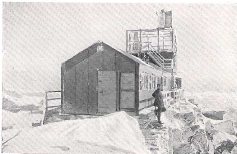
Capanna-Osservatorio • Regina Margherita • (4560 M. S. M.).

Presso la cima della Gnifetti, dove la piramide rocciosa estolle come un prezioso sigillo di volontà umana la capanna - osservatorio, la scena è quasi interamente cambiata: ogni cosa affonda lentamente in un mare di nubi grigio dorate, ed emergono come e-