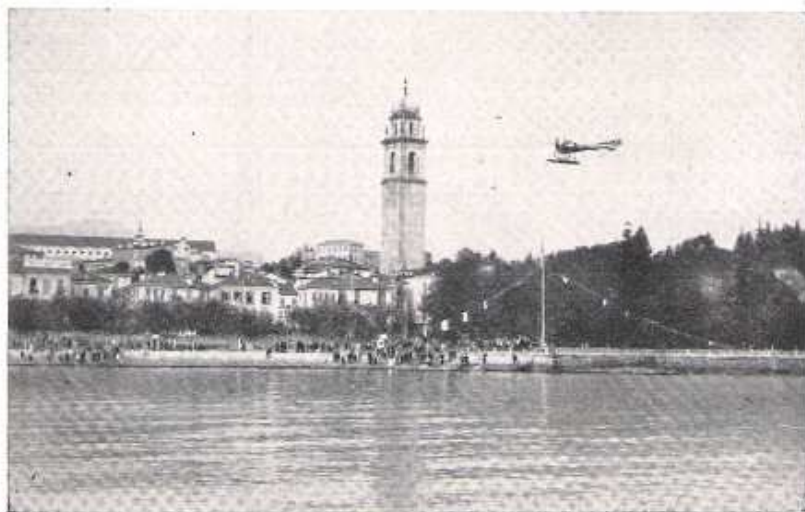
L'idroplano durante un volo a Pallanza