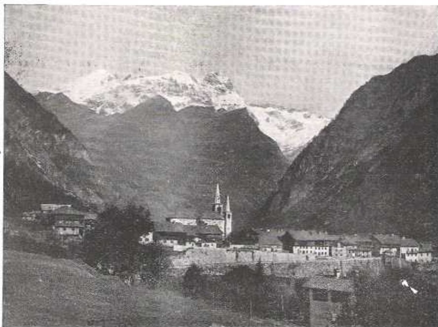
Alagna e il Monte Rosa da Riva Valdobbia

E questo non si fa attendere dopo un pranzo da