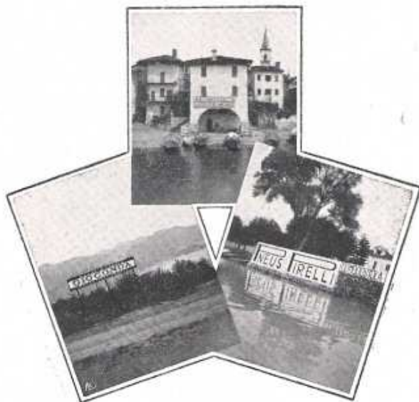
L'Isola Pescatori dal battello Il Golfo Borromeo dalla Ferrovia del Mottarone (istantanee di A. Massara)

pittoresca. Ma senza andar fuori d'Italia, l'affissione è limitata a Venezia come a Milano cosicché essa non può invadere gli edifici di pregio storico ed artistico, e nessuna réclame di pneumatici può coprire ad esempio le colonne esterne del Sant'Ambrogio, non si vede per qual ragione qui su questo nostro magnifico lago che strappa gridi d'ammirazione ai passeggeri più impermeabili, tutto debba essere concesso a Pallanza, a Stresa, e come lungo la ferrovia del Mottarone.