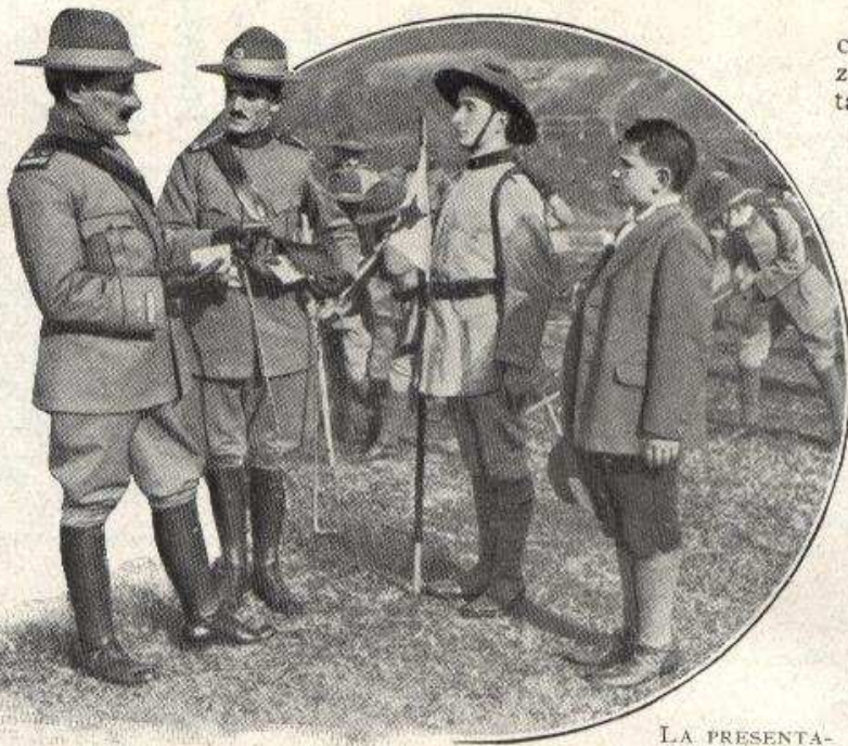
LA PRESENTAZIONE DI UNA RECLUTA AL COLONNELLO DEL CORPO.