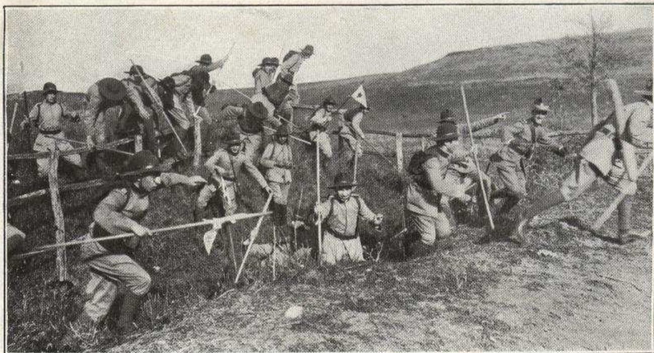
LA MOVIMENTATA CONQUISTA DI UNA POSIZIONE.

prestato il giuramento solenne: « Io giuro sul mio onore di fare quanto dipende da me per compiere in ogni circostanza il mio dovere verso la patria e verso coloro da cui dipendo, aiutare i miei simili e obbedire alle leggi speciali del corpo degli esploratori ». Il ragazzo che ha pronunciato ad alta voce e davanti ai compagni questo giuramento si trasforma ben presto in un ometto serio energico cavalleresco. Egli sente già con legittimo orgoglio la responsabilità dell'uniforme e dalla fiera grave del suo sguardo di piccolo generale traspare tutta la gioia con cui va a partecipare alle prime manovre. Oh, l'uniforme degli esploratori, disperazione di tante mamme, sogno di tanti bambini: a Roma essa è già popolarissima; e nei giorni di festa una gran folla accorre a salutare alla Farnesina le compagnie dei ragazzi che di buon mattino partono pel campo e, quando essi tornano, si improvvisano sempre nei quartieri più popolari dimostrazioni simpatiche che accendono nei piccoli cuori l'ardore delle future battaglie.