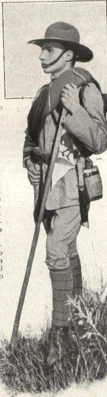
UN ESPLORATORE IN COMPLETO EQUIPAGGIAMENTO.