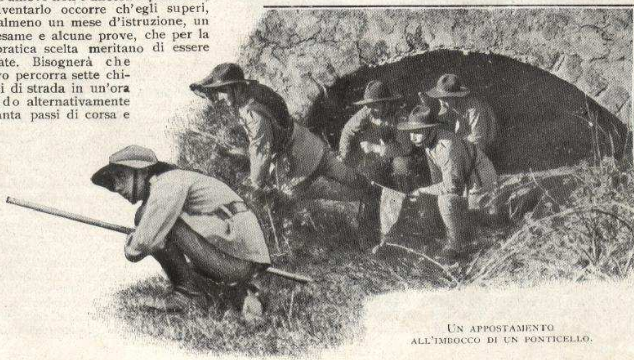
UN APPOSTAMENTO ALL'IMBOCCO DI UN PONTICELLO.

Infine l'esploratore sarà diplomato se egli saprà eccellere in una o più specialità; può cioè diventare specialista, come aiuto-aviatore, ambulanza, cucciniere, ciclista, macchinista, pontiere, pilota, elettricista, tiratore scelto, ecc. Si hanno così due altri gradi di perfezionamento: gli esploratori reali, abilitati nelle sei specialità di guerra, e i piccoli cavalieri, che sono gli esploratori reali in servizio almeno da