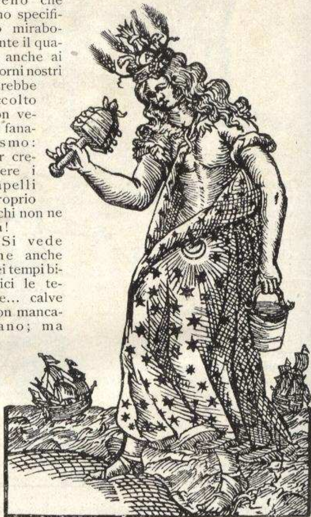
ISIS, MAGNA DEORUM MATER.

Si vede che anche nei tempi biblici le teste... calve non mancavano; ma