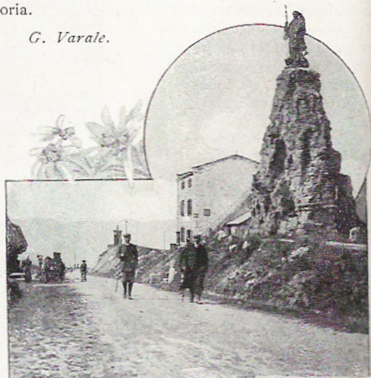
LA STATUA DI SAN BERNARDO AL CONFINE FRANCESE.