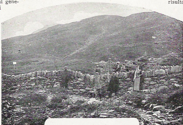
IL GIARDINO ALPINO « LA CHANOUSIA » AL PICCOLO SAN BERNARDO.